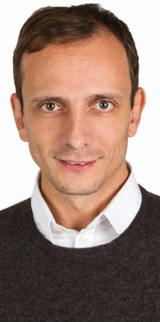
Massimiliano Fedriga Presidente della Regione Autonoma Friuli Venezia Giulia

“È con grande piacere che rivolgo il mio saluto a tutti gli atleti, ai tecnici, agli arbitri, ai dirigenti e agli accompagnatori che in questi giorni arrivano a Udine e in Friuli Venezia Giulia per prendere parte a un appuntamento ormai storico per la nostra regione e per la scherma internazionale.